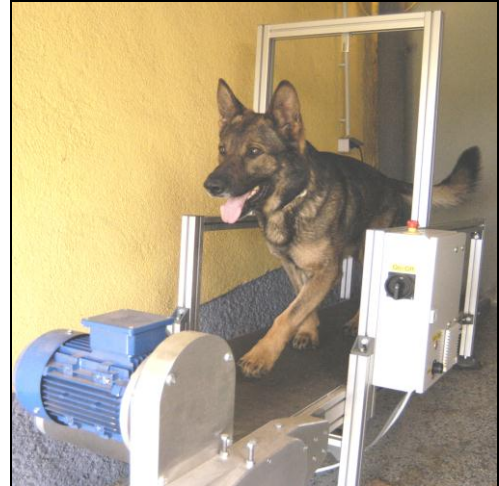
Training mit dem Economa Hundelaufband bei der Rettunghundestaffel